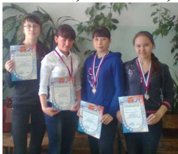
Победители районных соревнований по легкой атлетике

Наверно, 3 четверть можно считать самой спортивной четвертью. И в школе, и в районе прошло много спортивных мероприятий. Наши учащиеся достойно выступили почти во всех муниципальных соревнованиях.