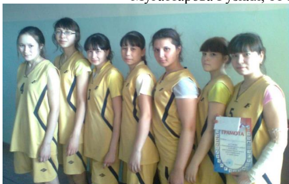
Команда девушек по волейболу