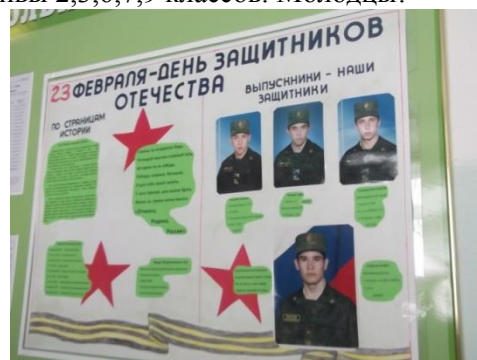
Стенгазета, посвящённая Дню защитников Отечества

А по итогам всего месячника I место заняли коллективы 2,3,6,7,9 классов. Молодцы!