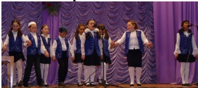
Учащиеся 4 класса – победители младшего звена

В прошлом учебном году наша школа участвовала в межмуниципальном проекте «Разработка и реализация образовательно-воспитательных проектов по формированию культуры толерантности учащейся молодежи». И вот второй раз в рамках этого проекта прошел творческий конкурс «Есть у народной песни крылья...» с участием всех классных коллективов нашей школы.