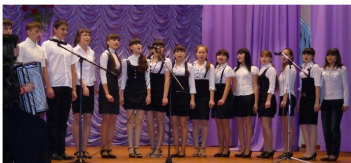
Учащиеся 9,10 классов – победители старшего звена