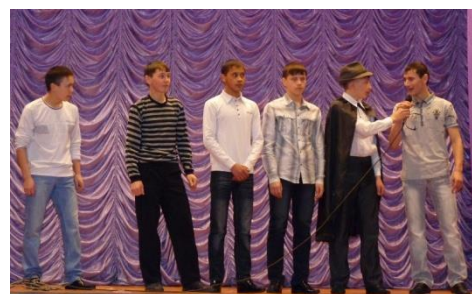
Конкурс «А ну-ка, парни!»