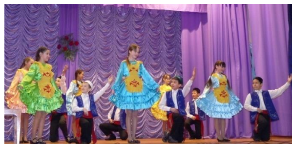
Многokrатный победитель и призёр фестиваля - ансамбль народного танца «Тахир-Зухра»