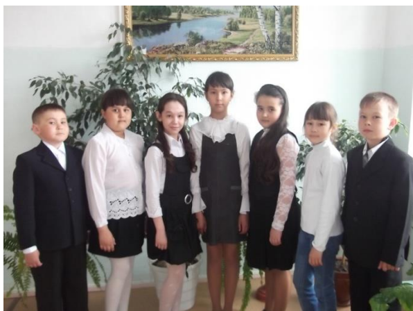
Победители и призёры межмуниципальных олимпиад среди начальных классов