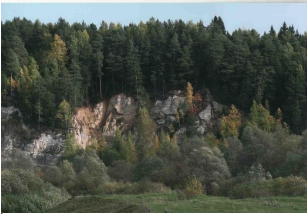
Создай, но не навреди тому, что есть!

Здорово жить в сельской местности. Я очень люблю свое село. Часто хожу в лес. На речку или на озеро. Самое лучшее место в моем селе - это лесное озеро. Именно здесь можно отдохнуть, позагорать, покупаться. А рыбачить здесь – одно удовольствие. На песчаном берегу можно наслаждаться живописными берегами. Озеро, как волшебное зеркало, скрывает в себе очень много загадок. О нашем озере слагаются легенды. Особенно оно красиво осенью. Летом возле озера можно рисовать отличные пейзажи. Смотришь на озеро, ощущаешь легкое дуновение ветра, приятные солнечные лучи. Очень красивы в моем селе и летние вечера, когда заходит солнце. Солнышко медленно опускается, и яркие краски расплываются по небу. Часто люди, которые живут в городе, не замечают всего этого великолепия. А время проходит. Стоит научиться останавливаться и отдыхать на природе. Не нужно куда спешить, а следует просто жить.